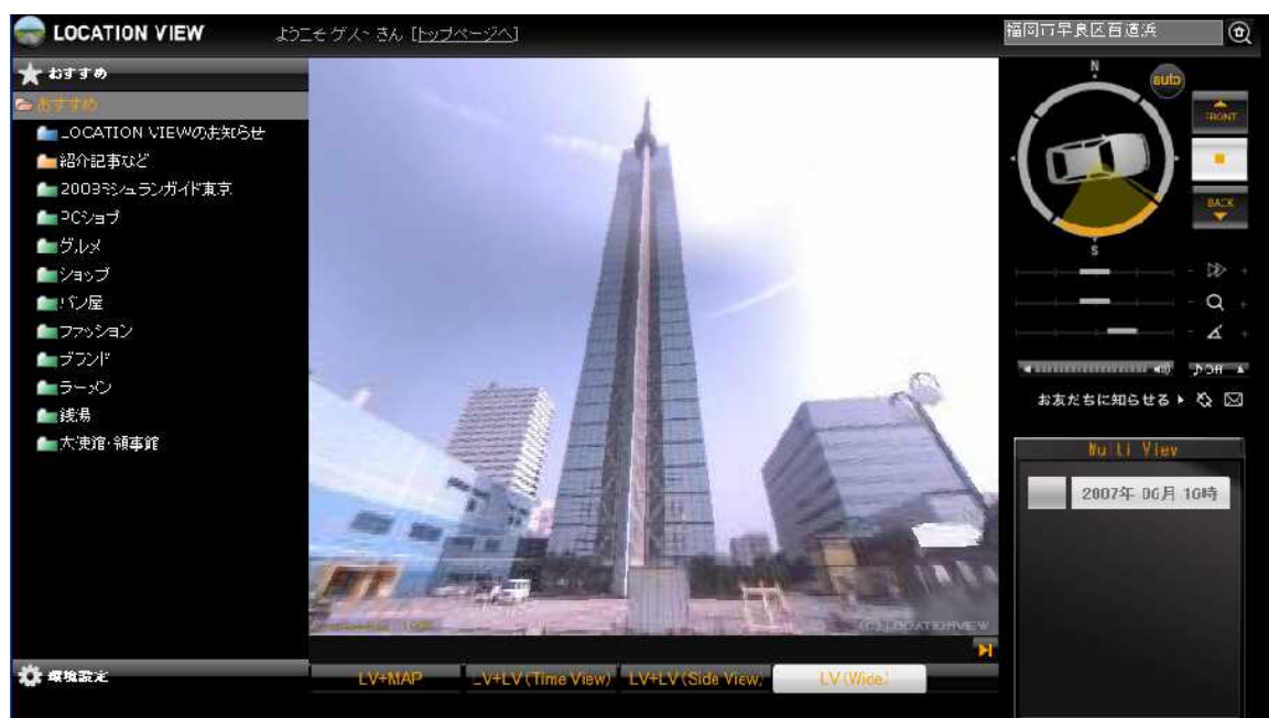
福岡タワー（福岡市早良区）

株式会社ロケーションビュー（本社：東京都千代田区、代表取締役社長：池添 吉則）は、360°ハイブリッドマップ「LOCATION VIEW」において、福岡市エリアの撮影データを公開いたします。一般公開開始後は、画像ダウンロード数は累計で1億2,000万件を超え *1 、順調に推移しています。皆様には引き続き新感覚の映像地図サービスをお楽しみいただけ、エリア拡大と利用者の拡大によって益々二酸化炭素削減に貢献していきたいと考えております。